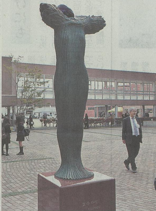
学校法人光星学院の創立60周年を記念し光星高校の中庭に設置されたモニュメント