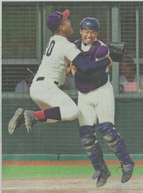
弘学聖愛 八学光星選手(左)が、八学光星の捕手(右)と喜びを分かち合う。この瞬間は、八学光星の勝利を告げる瞬間でもあった。

「気持ち」が勝負の鍵だった。弘学聖愛と八学光星の対戦は、6年ぶり。弘学聖愛は、5年連続で決勝に進出した八学光星が6-4で弘学聖愛を打ち、2年ぶり9度目の夏の甲子園の切符を手にした。