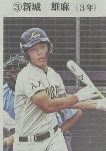
①一塁手②2005年8月25日③右、右④177㉜、86㉜⑤大阪・豊崎⑥長打力と守備力の格になし⑦全国制覇します