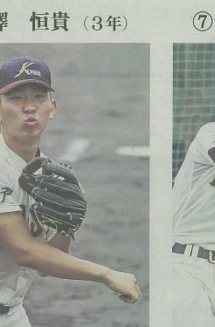
①遊撃手②2005年7月3日③右、右④180㉜、80㉜⑤埼玉・春日部共栄高附⑥逆方向へのバッティングの高橋由伸(元巨人)⑦全国制覇