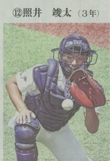
①捕手②2005年10月28日③右、右④168㉜、74㉜⑤岩手・和賀西⑥笑顔と声でチームを盛り上げます⑦マイク・トラウト(米・エンゼルス)⑧自分の役割を全うして頑張ります