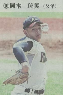
①投手②2007年2月12日③左、左④175㉜、80㉜⑤東京・板橋二⑥冬に鍛えてきた真っすぐ⑦松井裕樹(楽天)⑧一戦必勝で最終的には日本一になりたい